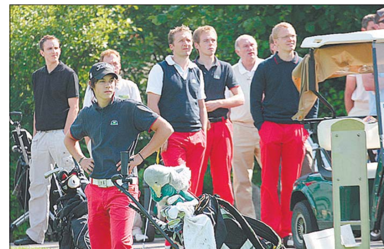
Gespannte Blicke beim ersten Abschlag. Schnell sollte sich herausstellen, dass das Haller Team seinen Heimvorteil nutzen würde.